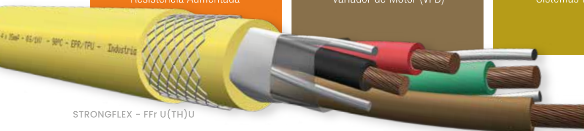
STRONGFLEX - FFr U(TH)U