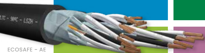
ECOSAFE - AE

Instrumentación, Potencia y Comando (Resistencia al Fuego)