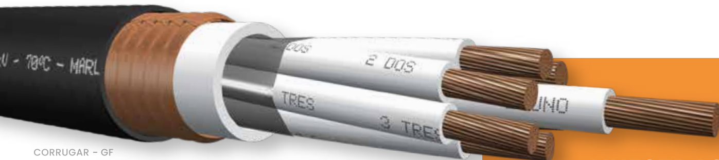
CORRUGAR - GF